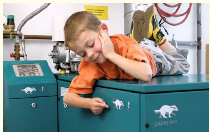
Auch der „Dachs“ macht mit.