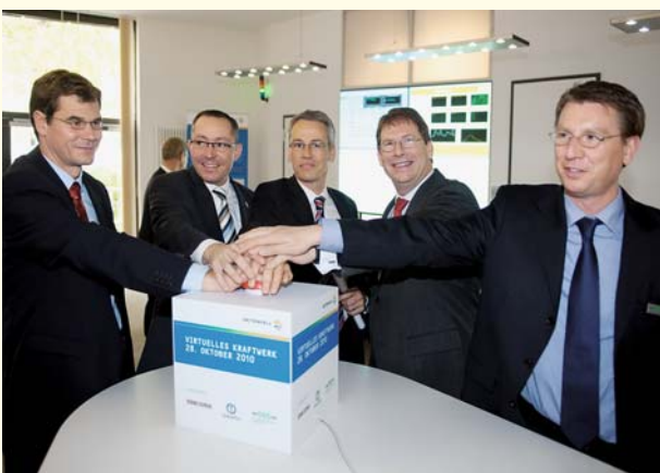
Start des virtuellen Kraftwerks.

Wobei die Stiebel-Eltron-Wärmepumpe im virtuellen Kraftwerk stromflusseitig nur virtuell eingebunden ist. Sämtliche Erzeuger, also auch die BHKW, speisen in ein- und dasselbe öffentliche Netz ein, und sämtliche Nutzer entnehmen hier die Energie. Die Wärmepumpe steht so gesehen mehr stellvertretend für die Ökostromverbraucher und den Effizienzansatz. Zur Leitwarte der Vattenfall existiert jedoch eine regelungstechnische Abhängigkeit: Wenn in Strom-Schwachlastzeiten viel Wind- und BHKW-Strom anfallen, bedarf