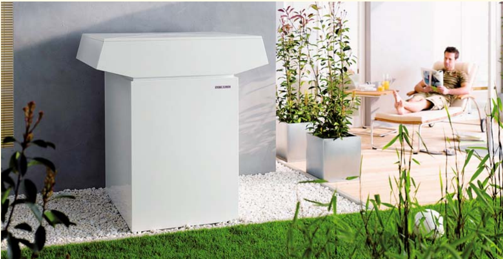
Stiebel-Eltron stellt die Wärmepumpen.