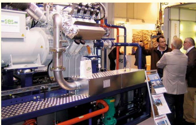
SES-BHKW im Verbund.