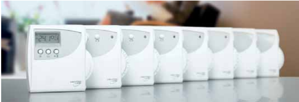
CO 2 -Sensoren, wie die der Command-Serie von Centraline, erfassen den exakten CO 2 -Gehalt eines Raumes und bieten zudem formschöne Funktionalität.

Die neue DIN EN 13779 [2] für Lüftungs- und Klimaanlage ist eine der ersten europäischen Richtlinien, die auf Basis der „Energy Performance of Buildings Directive“ (EPBD) neue Ausführungsrichtlinien definiert. Diese Richtlinien geben Planern eine aktive Hilfestellung, wie die Forderungen der EPBD ausgeführt werden können. Insgesamt kann so die Energieeffizienz von Lüftungs- und Klimaanlage erheblich gesteigert werden.